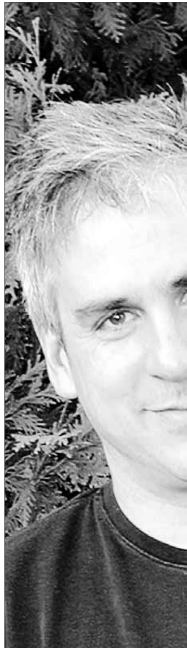
El escritor norteamericano Ethan Canin.

Con un excepcional rigor histórico, Ethan Canin nos muestra la América anterior al Watergate, con una visión vacilante, la de su protagonista, entre la decepción y la nostalgia, que consigue contagiar al lector. América, América es un relato de iniciación, sobre la pérdida de la inocencia individual y colectiva, la historia del hombre hecho a sí mismo, muy del gusto de aquel continente; y es la historia de un joven seducido por el poder que logra sacar provecho y enseñanzas positivas de su experiencia, como ejemplo, una vez más, de que el sueño americano puede tener un final feliz, aunque algunas noches, demasiadas, las pesadillas perturben el descanso.