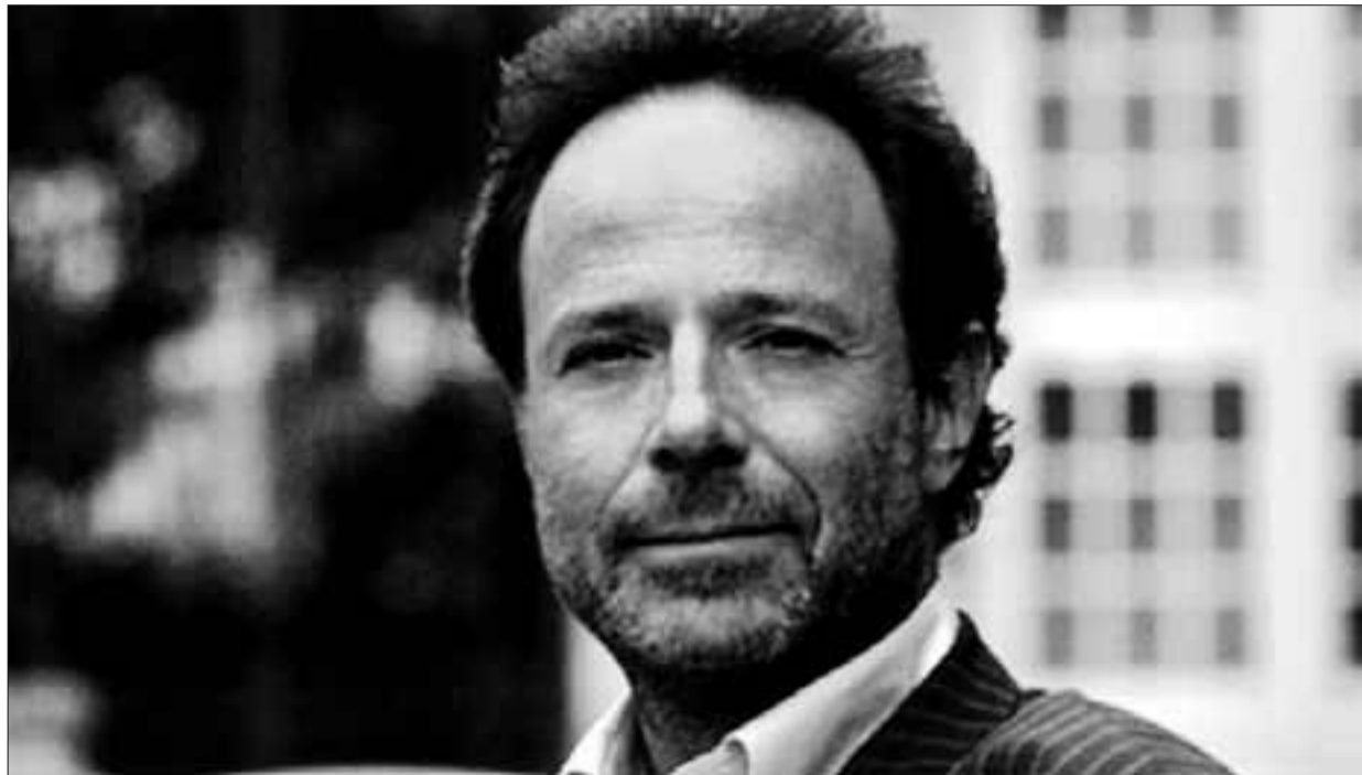
El escritor francés Marc Levy ha publicado El primer día . E. FANO

► «Es una de las Novelas Ejemplares , un ensayo narrativo corto muy interesante por la ironía con que el diálogo entre Berganza y Cipión trata temas de ayer, y también de hoy o de mañana, como el amor, la lealtad o las noblezas y flaquezas del ser humano, que además me asegura momentos refrescantes en un día cualquiera de intensa actividad».