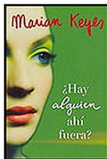
M. Keyes ¿Hay alguien ahí fuera? Plaza y Janés