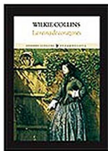
W. Collins La reina de corazones Funambulista